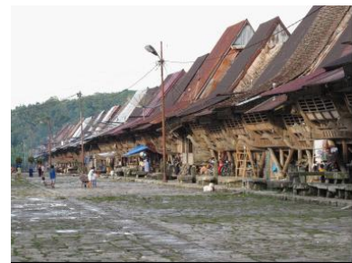
ニアス島の歴史的集落保存