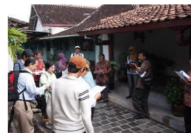
コタゲデ地区のワークショップ